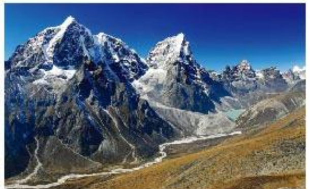
サガルマータ国立公園