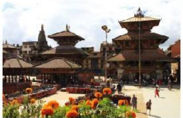
世界遺産：カトマンズ・ダルバール広場

ポカラ (Pokhara) そのものは現代的な町でネパール・ガンダキ県およびカスキ郡の首都。カトマンズから西に約200kmの位置、人口は約30万人で、ネパール第2の都市です。ペワ湖に面していて山あいの高地に囲まれているため年間約4000ミリ前後という国内最大の降水量が特徴ですが市内からは晴ればダウラギリ、アンナプルナ、マナスルという標高8000メートル級のヒマラヤの山々の頂きが見える観光地としても世界的に有名な場所です。