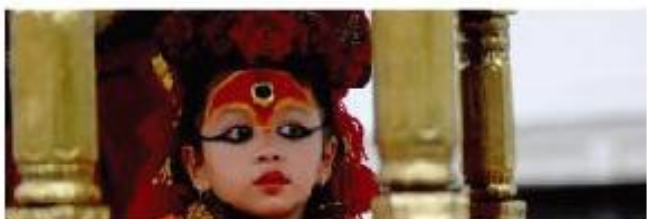
クマリ (Kumari, Kumari Devi) 幼い少女を生き神としてあがめる伝統があります。

※ネパールの言語 公用語はネパール語(ネパ リ)で、インドのヒンディ 語との共通点が多くありま す。民族ごとに違う言葉が あります。